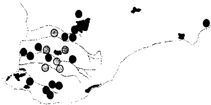
Рис. 2. Належність популяцій до двох головних клад (чорні та сірі кола), що було виділено для сумісного фенетико-географічного аналізу за трьома поліморфними конхіологічними системами молюска H. lucorum

Отримані оцінки ефективної чисельності популяцій достатньо низькі та відповідають отриманим раніше показникам для іншого виду цього роду Helix aspersa , що також існує у вигляді дрібних, дискретних, напівізоляованих колоній – 15–215 особин [5]. Раніше було встановлено, що для H. lucorum зазначаються дуже низькі оцінки щільності популяцій – 0,5–1,0 особина на 1 м 2 (В.М. Попов, особисте повідомлення).